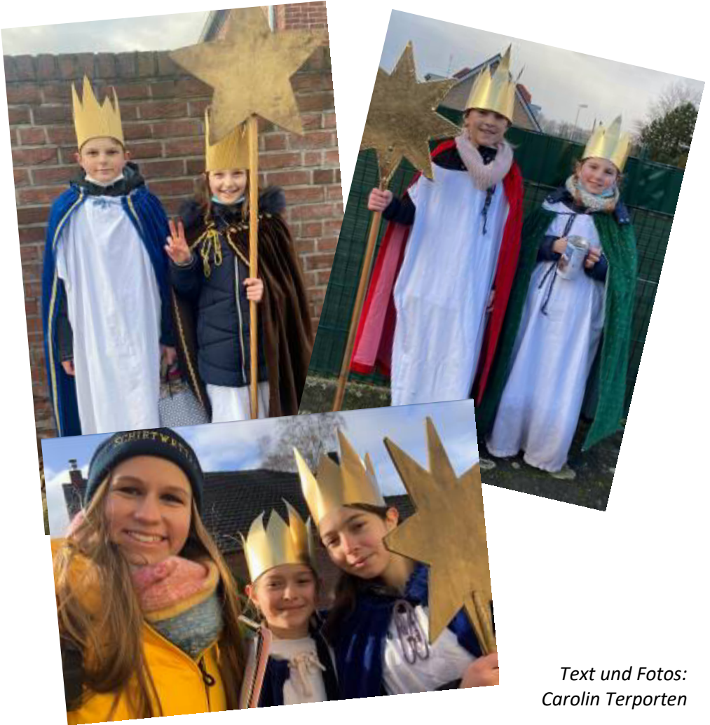
Text und Fotos: Carolin Terporten

Im nächsten Jahr hoffen wir dann wieder auf mehr Kinder, die Spaß dabei haben, als Sternsinger durch Breyell zu ziehen.