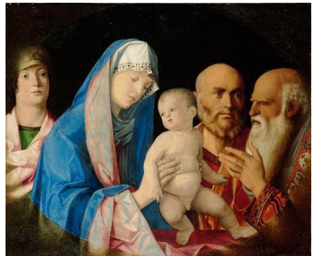
Bellini, Giovanni – Kunsthistorisches Museum, Wien

Die gesegneten Ostertischkerzen können Sie nach den Segnungen zum Preis von 4,50 € vor und nach den Gottesdiensten in der Kirche oder auch in den Pfarrbüros zu den Öffnungszeiten erwerben.