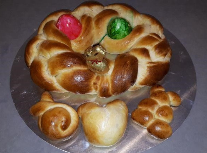
Text und Foto: Carolin Terporten

Zuhause ist und sich einsam fühlt, sodass sie zumindest ein kleines Lächeln ins Gesicht gezaubert bekommen hat. Die Kinder hatten eine Menge Spaß und die Ergebnisse sind sehr anschaulich geworden.