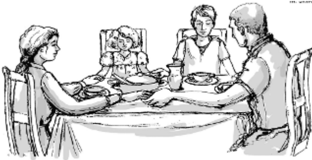
DAS TISCHGEBET: DER TÄGLICHE ERNTEDANK