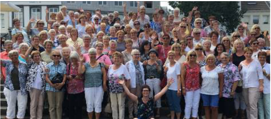
Text und Foto: Claudia Jansen

Bei herrlichstem Sonnenschein fuhr die katholische Frauengemeinschaft mit zwei Bussen am 18. Juli 2018 in die schöne Stadt Maastricht. 115 Frauen fanden sich um 9.00 Uhr am Jugendheim in Breyell ein. In Maastricht angekommen stiegen deutschsprachige Reiseführer in die jeweiligen Busse ein. Die Fahrt führte uns an diversen Sehenswürdigkeiten vorbei und wir erfuhren einiges über die Besonderheiten der schönen Stadt Maastricht. Nach einer aufschlussreichen Stunde ging es dann zum gemeinsamen Mittagessen am Ufer der Maas. Als alle gesättigt waren, lief man an der Maaspromenade entlang zur Schiffsanlegestelle. Bei einer einstündigen Schiffsrundfahrt konnten wir Maastricht vom Wasser aus entdecken. Bis zur Abfahrt gegen 18.00 Uhr hatten wir Gelegenheit zum gemütlichen Bummel durch die schöne alte Stadt. Das eine oder andere Café wurde aufgesucht oder aber auch Sehenswürdigkeiten, wie die Bibliothek in einer Kirche, konnten besichtigt werden. Alles in allem war es ein wunderschöner und erlebnisreicher Tag war. Danke an alle, die diese schöne Fahrt organisiert haben.